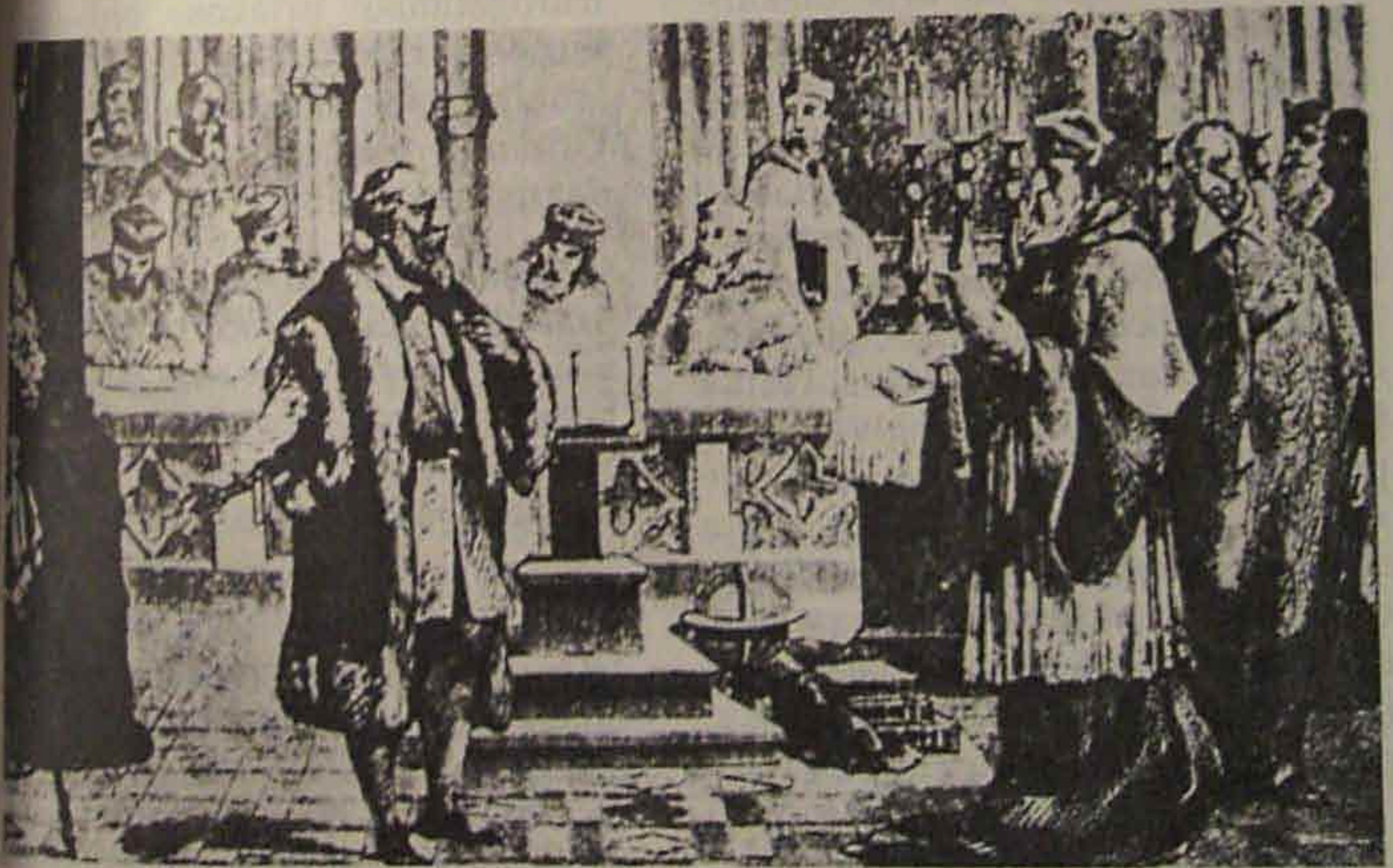
Galileo, eleiz-epaitegiaren aurrean.

Galileo'k somatu dau arriskua. Eta Erroma'ra doa eta alegiñak erreten ditu bere zintzotasunaz ja-betu daitezcan ango jakitunak eta kardenalak. Dana alperrik. 1616'ga-rreren urtea da, Shakespeare ta Zer-bantes il ziran urtea. Pizkundeak egin eban berea. Otsaillaren 18'an Eleiz Auzitegiak ereje lez gaiztes-ten dau «Eguzkia munduaren erdia dela ta, beraz, tokiko mugimentu-rik ez dauala diñoan dotriña». Suntsitua izan da Galileo, baiña itxuraz osorik urtetea lortu dau. Epaian ez da agertzen bere izenik.