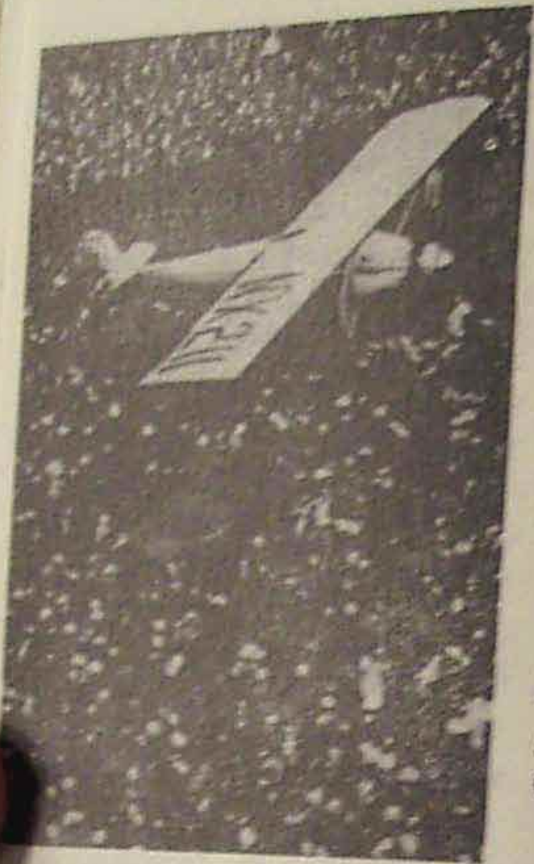
Paris'a iritxi zan unea.