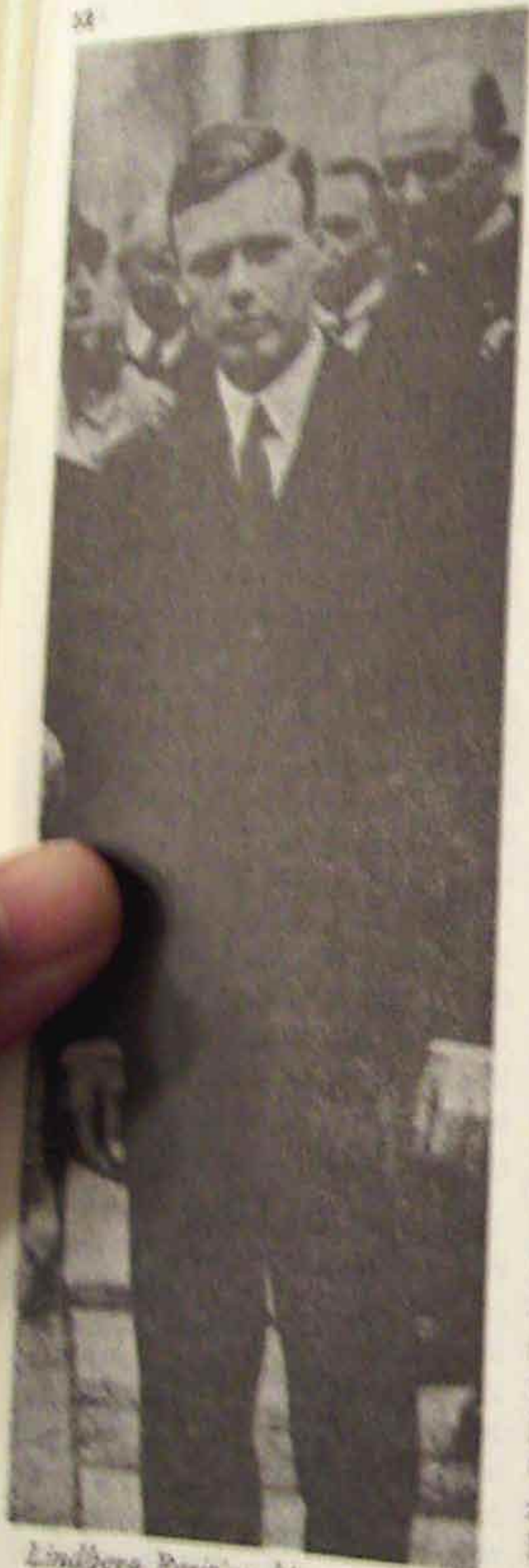
Lindberg Paris'en bideramonean.

naitaez, eta, andik laster Ameri- ka'rik eturren egazkiak Europa ko lurra ikutzen eban bere gurpe- llakaz. Orreig'en saria irabazi du. Garaipen zorianantua benetan, bai- ña baita ezbear ikaragarria be- mea lapurtu ta il egiten du.